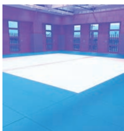
富山県警機動隊様

前回同様、(株)オオツジ様からのご注文で152帖全面の入れ替えです。こちらも場内をイエロー50帖と場外をグリーン102帖の配色で一新いたしました。