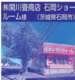
(株)関川豊商店 石岡ショールーム様 (茨城県石岡市)