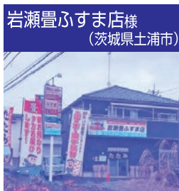
岩瀬豊ふすま店様 (茨城県土浦市)

【2日目】6月3日(土) 豊店様見学会 大型バスに分乗して、 3社4店舗を見学させて いただきます。