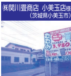
(株)関川豊商店 小美玉店様 (茨城県小美玉市)