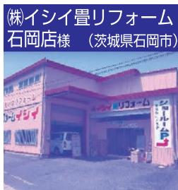
(株)イシイ豊リフォーム 石岡店様 (茨城県石岡市)