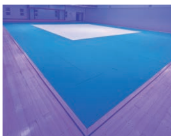
松戸市運動公園様

武道場の耐震補強に合わせての入れ替え工事となります。配色はワサビ色とアカ色から北京オリピックカラーのグリーンとイエローで一新されました。