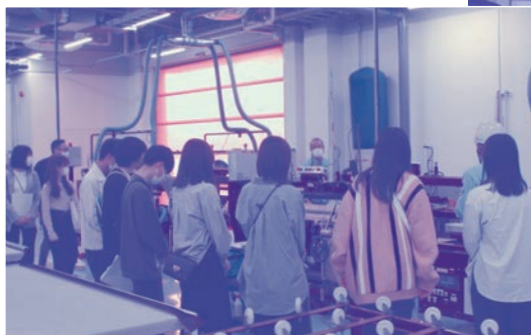
令和5年4月21日(金) 当社神岡新工場