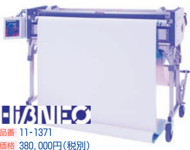
品番 11-1371 価格 380,000円(税別)

今月は「快適」をいっぱい詰め込んだコンパクトモデル「Hiβ・NEO」のご案内です。同機の「快適」な魅力をご紹介します。