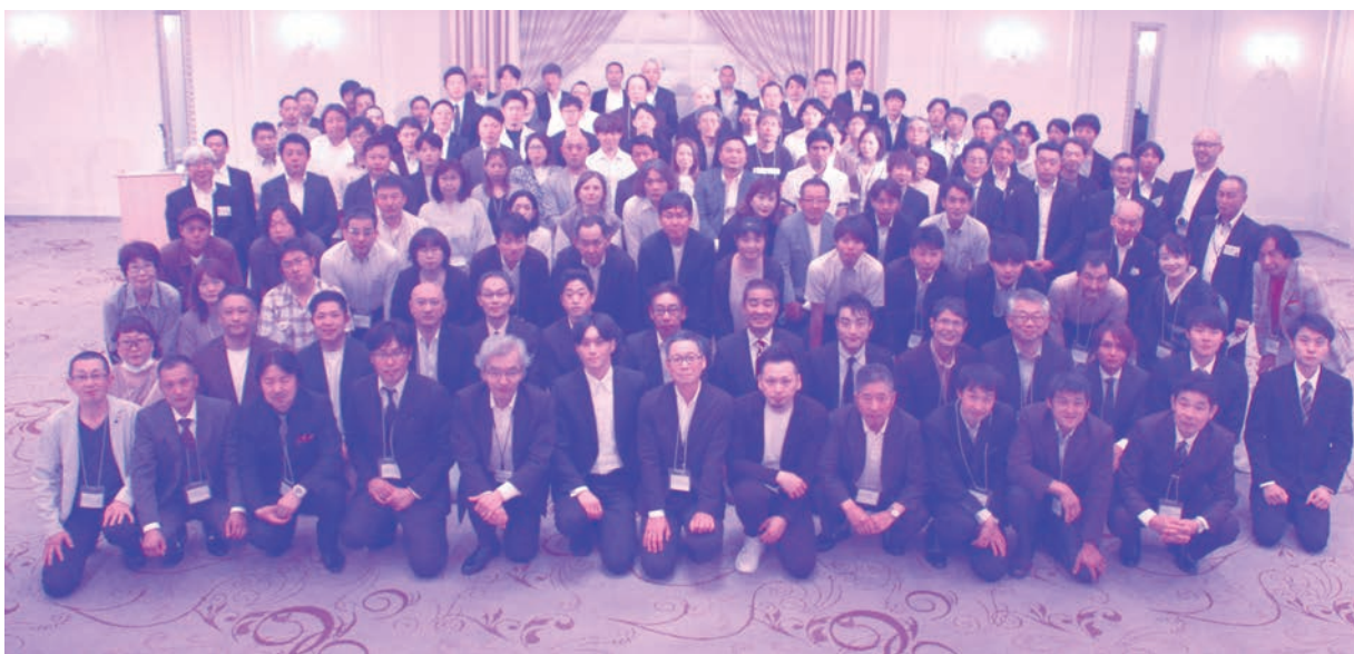
令和5年6月2日(金) 品川プリンスホテル

発行／極東産機株式会社 〒679-4195 たつの市龍野町日飼190 ☎(0791)62-1771 編集／極東産機(株)総務部 ホームページアドレス https://www.kyokuto-sanki.co.jp/