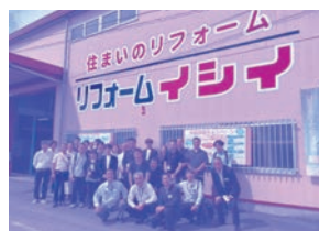
茨城県石岡市 株式会社 イセイ豊リフォーム 石岡店様