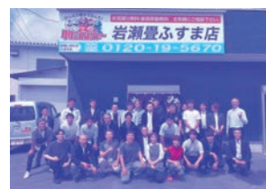
茨城県土浦市 岩瀬豊ふすま店様