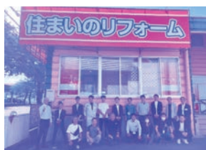
茨城県石岡市 株式会社 関川豊商店 石岡ショールーム様

豊店様の「縁の下での力持ち」として積極的に設備投資をおこなわれ、職場環境を整え、良い職場風土を作られ、社員が定着されているお話をご講演いただきました。