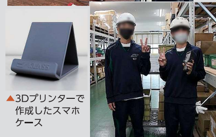
▲3Dプリンターで作成したスマホケース