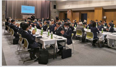
龍野商工会議所臨時総会で会頭再任が決定 (令和7年11月4日)